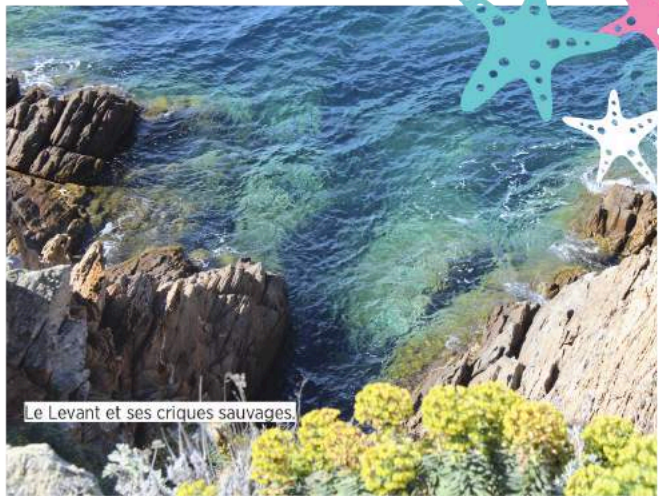
Le Levant et ses criques sauvages.