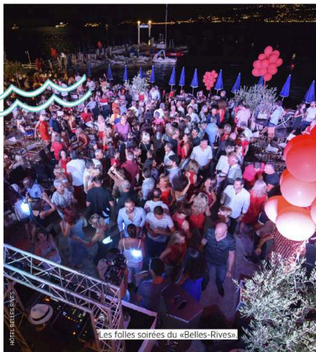
Les folles soirées du «Belles-Rives».