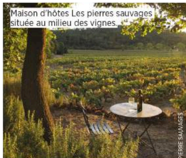
Maison d'hôtes Les pierres sauvages située au milieu des vignes.