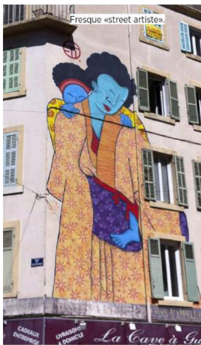
Fresque «street artiste».