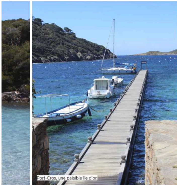
Port-Cros, une paisible île d'or.