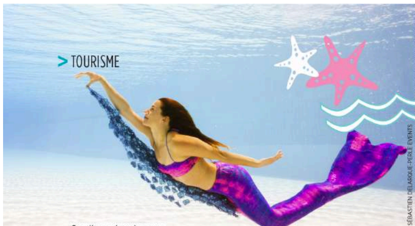
Se glisser dans la peau d'une sirène.