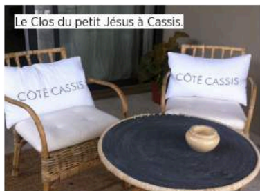
Le Clos du petit Jésus à Cassis.