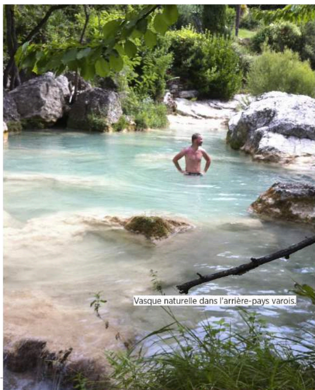
Vasque naturelle dans l'arrière-pays varois.