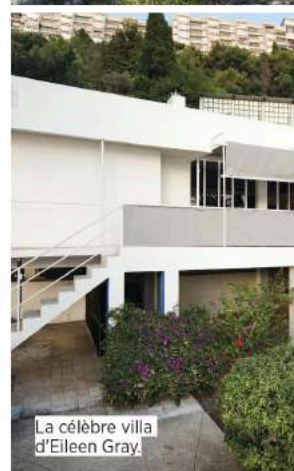
La célèbre villa d'Eileen Gray.

• Cultivez votre sens critique contemporain à Roquebrune Cap-Martin . Bienvenue au Cap Moderne, réunissant la villa E-1027 d'Eileen Gray, le Cabanon et les Unités de camping du Corbusier, et le bar-restaurant l'Etoile de mer. Trois univers d'expérimentations architecturales, entre nature et design, à découvrir au cours d'une visite guidée de 2 heures. (Rés. obligatoire. 18 €/pers., capmoderne.com )